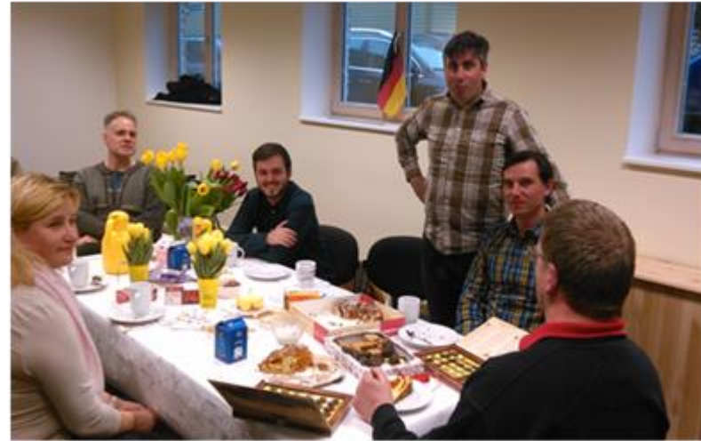
Kirchenkaffee im neuen Raum mit Tallinnern und Wolkendörfern.

Es ist sehr erfreulich, nun Gäste sogar in einem eigenen Raum begrüßen zu können. Wir freuen uns immer über Besuch!