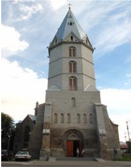
Unter dem Hammer: Die Alexanderkirche in Narva.

Kirche sich für ihre Fehlleistungen in dieser Sache schäme und er die Bevölkerung um Vergebung bitte.