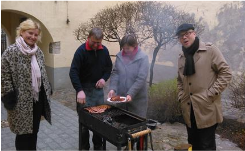
Eilig und lecker: Abschied von der Tolle mit Grillen bei frischen Temperaturen.

Am selben Tag feierten wir wie gewohnt unseren Gottesdienst in der Schwedischen Michaeliskirche (während des Gottesdienstes setzte heftiger Regen ein-glücklicherweise nicht schon beim Grillen!) und fuhren zum Kirchkaffee in die neuen Gemeinderäume.