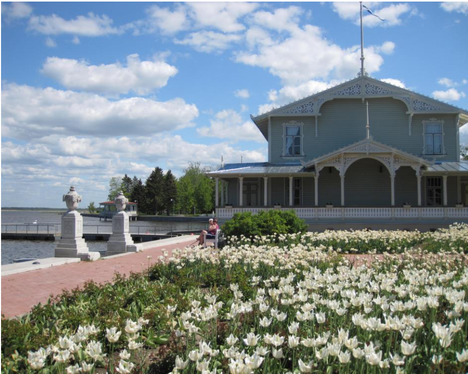
Pfingstsonntag in Haapsalu.

„Zur Freiheit hat uns Christus befreit! Lasst euch nicht wiederum ins Joch der Knechtschaft fangen!“