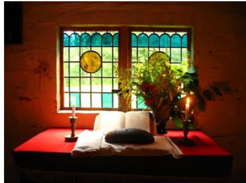
Wort, Brot und Licht: Der Altar der Sutlepa-Kapelle im Freilichtmuseum.

einige Tausend Arbeitskräfte frei-gesetzt wurden, sinngemäss: „Ein gutes Zeichen: Estland ist endlich kein Niedriglohnland mehr.“